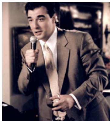
Mr Big (Chris Noth).

Si les coups « vite faits bien faits » animent en majeure partie les premières saisons délurées de la série, où les filles ont soif d'expérience et sont prêtes à tout pour dénicher le mâle idéal, dès le pilote apparaît le mystérieux Mr Big (Chris Noth). Mystérieux, car son prénom ne nous sera dévoilé qu'au cours de l'épisode final. Mystérieux, car Carrie le surnomme spontanément « Mr Big » (voir encadré « Le livre à l'origine de la série ») sans nous donner d'explications.