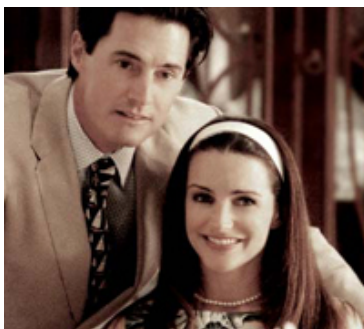
Trey McDougal (Kyle MacLachlan) et Charlotte.

Charlotte souhaite tellement se marier, avoir des enfants, mener une vie de mère épanouie, que les échecs la rendent désespérée. Suite à une nouvelle « erreur de casting », elle trébuche dans la rue, un taxi manque de l'écraser.