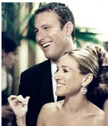
Aidan Show (John Corbett) et Carrie.

Plus ou moins remise, Carrie drague un créateur de meubles artisanaux dans son magasin. Aidan Show (John Corbett), pour vous servir ! Mr Big est l'ombre, Aidan la lumière. De nature franche et ouverte, Aidan se révèle être un compagnon fidèle, limite vieux jeu pour Carrie :