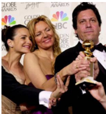
Kristin Davis, Kim Cattrall et Darren Star, le créateur de la série.