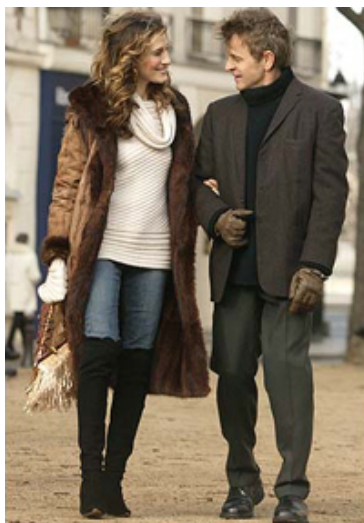
Carrie et Aleksandr Petrovsky (Mikhail Baryshnikov).

Un livre tiré de la chronique hebdomadaire de Carrie lui offre l'occasion de rencontrer Jack Berger (Ron Livingston), lui-même écrivain. Il se sépare de sa petite amie et capte l'attention de Carrie par son humour vivace. Bientôt, une passion complexe prend forme. Le « favori de ses amies » bloque au lit. Puis sa carrière en chute libre, contrairement à celle de Carrie qui décolle, jette un froid entre eux deux.