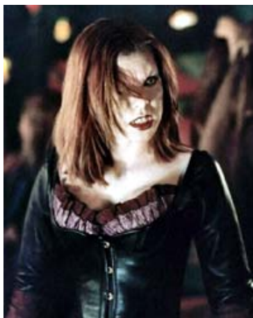
Willow Rosenberg (Alyson Hannigan).

Alex cherche toujours sa place dans le groupe et dans la vie, et Buffy s'occupe de sa petite soeur pour qui sonne le jour de la rentrée ! Comme dans la première saison, la rentrée scolaire entraîne certains événements qui marqueront l'intrigue. Robin Wood, le nouveau principal, propose à Buffy un poste de conseillère d'éducation. La parenthèse comique du Double Meat Palace est terminée.