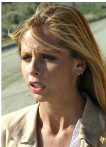
Buffy Summers (Sarah Michelle Gellar).

Les aventures de la Tueuse ne semblaient jamais devoir se terminer ! Seulement voilà, Buffy a tiré sa révérence. Il faut dire que pendant ces sept années, elle « aura beaucoup sauvé le monde ». Joss Whedon, lui, aura renouvelé avec talent les thèmes abordés dans les séries. Méprisée par certains, adulée par d'autres, Buffy contre les vampires restera, dans nos mémoires, un éblouissant exercice de style et un vrai coup de coeur.