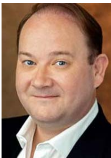
Marc Cherry, le créateur de Desperate Housewives .

Ce qui peut sembler étonnant de prime abord, c'est qu'un univers aussi féminin que celui dont on nous dresse ici le tableau soit issu d'un cerveau masculin : celui de Marc Cherry. Ce dernier a toutefois une mère dont il n'a jamais caché, depuis le lancement de la série, qu'elle lui avait inspiré à la fois le personnage de Bree Van De Kamp et certains traits de caractère de ses autres héroïnes, à commencer par l'exaspération de Lynette Scavo face à la conduite de ses chérubins [3]. Sans oublier les anecdotes issues de la propre enfance et de l'adolescence de Cherry, transposées à l'écran de façon à peine « romancée » : les gamins si insupportables à l'arrière de la voiture conduite par leur maman que celle-ci les fait descendre sur le trottoir et les y « abandonne » (avant de revenir sur ses pas quelques secondes plus tard), le chewing-gum irrémédiablement collé dans les cheveux de l'un des gosses en question (dans la réalité, ce fut la soeur de Marc Cherry qui fit l'objet de cette désagréable expérience), etc.