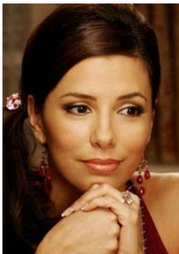
Gabrielle Solis (Eva Longoria).

La quatrième enfin pense avant tout à se laisser vivre (les mauvaises langues diraient : « à se laisser dériver »).