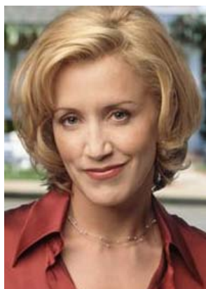
Lynette Scavo (Felicity Huffman).

et ne supporte pas la vue d'un bouton sur le point de se séparer du vêtement qu'il est censé fermer (un spectacle aussi insoutenable la conduisant à se saisir toute affaire cessante du nécessaire de couture qui ne la quitte jamais) ni le moindre « désordre » (auquel cette excellente tireuse, membre de la très puissante et conservatrice National Rifle Association, est capable de réagir fusil à l'épaule). Si son éducation conservatrice a contribué à la rendre particulièrement soucieuse de son apparence (aucune salissure ne saurait être tolérée sur ses élégants tailleurs ni sur ses impeccables chemisiers, aucune maille de ses tricots ni de ses collants ne saurait être autorisée à filer, pas plus qu'une mèche rebelle ne saurait dépasser impunément de sa flamboyante mise en plis), Bree Van De Kamp se démarque pourtant des WASPs [1] que leur sophistication rend parfois étriqués et égocentriques. Sincèrement à l'écoute d'autrui, elle est ainsi prête à épauler en toute occasion quiconque fait appel à ses services. Mais cela ne la met nullement à l'abri des petites (voire des grosses) trahisons dont peuvent à l'occasion se rendre coupables des proches auxquels elle estime avoir toujours donné, en s'efforçant de mille façons d'embellir leur quotidien, la meilleure preuve d'un sincère attachement.