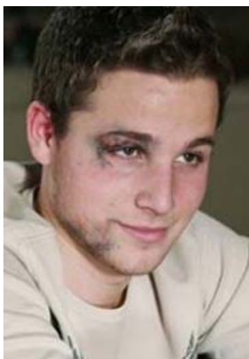
Andrew Van De Kamp (Shawn Pyfrom).

On peut toutefois espérer pour leur maman que ces « bons petits diables » ne suivront pas l'exemple d'un certain Andrew Van De Kamp (Shawn Pyfrom),