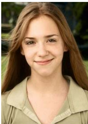
Julie Mayer (Andrea Bowen).