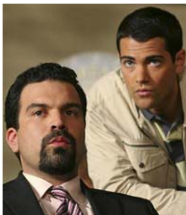
Carlos Solis (Ricardo Antonio Chavira) et John Rowland (Jesse Metcalfe).

d'impliquer les homosexuels vivant à Fairview, ce qui lui coûtera « mucho »...), subit bien évidemment le « déshonneur » qu'il craignait par-dessus tout : en dépit de tout ce qu'il lui offre, estimant que cela devrait suffire à la rendre heureuse, sa ravissante épouse le « cocufie » effectivement sans vergogne avec John Rowland. À noter que l'athlétique jardinier, encore adolescent il est vrai au moment où s'ébauche cette liaison, fait preuve en ce qui concerne « les choses de l'amour » d'une telle immaturité qu'il n'appelle jamais sa maîtresse autrement que « Madame Solis »