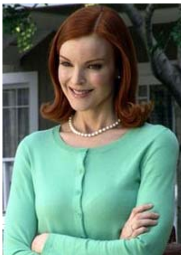
Bree Van De Kamp (Marcia Cross).

et ne supporte pas la vue d'un bouton sur le point de se séparer du vêtement qu'il est censé fermer (un spectacle aussi insoutenable la conduisant à se saisir toute affaire cessante du nécessaire de couture qui ne la quitte jamais) ni le moindre « désordre » (auquel cette excellente tireuse, membre de la très puissante et conservatrice National Rifle Association, est capable de réagir fusil à l'épaule). Si son éducation conservatrice a contribué à la rendre particulièrement soucieuse de son apparence (aucune salissure ne saurait être tolérée sur ses élégants tailleurs ni sur ses impeccables chemisiers, aucune maille de ses tricots ni de ses collants ne saurait être autorisée à filer, pas plus qu'une mèche rebelle ne saurait dépasser impunément de sa flamboyante mise en plis), Bree Van De Kamp se démarque pourtant des WASPs [1] que leur sophistication rend parfois étriqués et égocentriques. Sincèrement à l'écoute d'autrui, elle est ainsi prête à épauler en toute occasion quiconque fait appel à ses services. Mais cela ne la met nullement à l'abri des petites (voire des grosses) trahisons dont peuvent à l'occasion se rendre coupables des proches auxquels elle estime avoir toujours donné, en s'efforçant de mille façons d'embellir leur quotidien, la meilleure preuve d'un sincère attachement.