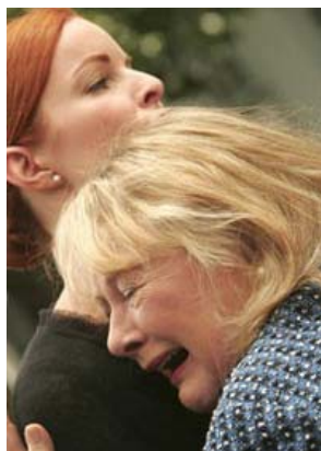
Bree et Phyllis Van De Kamp (Shirley Knight).

Que dire par ailleurs des « aînées », belle-mères ou mères de nos héroïnes,