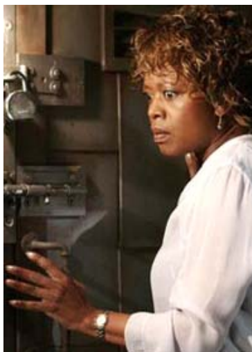
Betty Applewhite (Alfre Woodard).

Lorsqu'une des maisons de la rue est mise en vente, c'est encore une femme qui en fait l'acquisition et qui vient s'y installer de nuit sans même l'avoir visitée au préalable (son descriptif, fourni par une Edie Britt ravie de se trouver au centre de cette fructueuse transaction immobilière, ayant visiblement conquis la nouvelle propriétaire). Betty Applewhite (Alfre Woodard), mère d'un grand jeune homme prénommé Matthew (Mehcad Brooks), affiche d'ailleurs une discrétion qui ne tarde pas à paraître suspecte dans une communauté où la curiosité a toujours été de mise. Et en l'occurrence, il y a réellement matière à s'inquiéter puisque cette talentueuse pianiste et son fils retiennent prisonnier dans leur cave un pauvre bougre que ses capacités intellectuelles limitées empêchent de dénoncer l'injustice du traitement dont il est victime. Mais la nouvelle venue n'a rien non plus de la mère indigne qu'on aimerait détester : persuadée qu'il est de son devoir de soustraire du monde un être qu'elle ne demandait qu'à chérir, résolue à procéder elle-même, si le besoin s'en fait sentir, au sacrifice de la chair de sa chair, cette afro-Américaine se révèle en définitive beaucoup plus pathétique que cruelle.