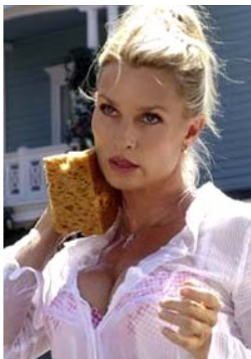
Edie Britt (Nicollette Sheridan).