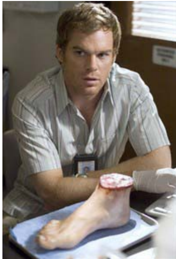
Dexter Morgan (Michael C. Hall).

Dexter Morgan est expert médico-légal, spécialiste des projections de sang au service de la police de Miami. Un statut qui pourrait faire passer ce « collègue » du lieutenant Horatio Caine, de Calleigh Duquesne, d'Eric Delko et des autres personnages des Experts : Miami , eux aussi engagés dans la police scientifique locale,