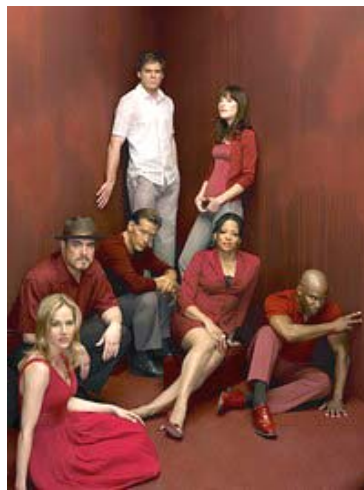
Une affiche promotionnelle annonçant la saison 2.

L'originalité de ce programme réside également dans son traitement visuel. Les visages sont cadrés de telle sorte que le téléspectateur a souvent l'impression que la barrière le séparant des pensées des personnages est sur le point de se rompre (ce qui est d'autant plus vrai, dans le cas de Dexter, que la voix off nous permet bel et bien de connaître les pensées en question). Et lorsque les protagonistes apparaissent dans des plans larges,