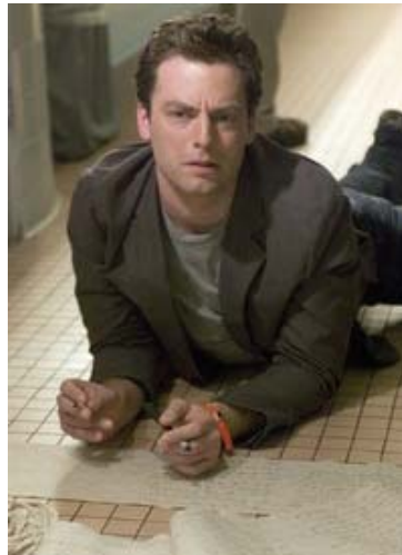
Andy Botwyn (Justin Kirk).

Le mari infidèle dûment puni (sa femme lui rase le crâne durant son sommeil) et l'adolescente rebelle une fois « écartée » (grâce à un aller simple pour le Mexique et ses « merveilleuses » pensions), reste à régler le cas plus complexe de l'obsésité de sa cadette, Isabelle... dont Celia remplace les réserves de chocolat consommées en cachette par un produit laxatif !