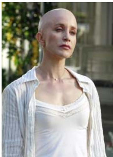
Lynette Scavo (Felicity Huffman).

filles, désireuse de connaître le rôle qu'a réellement tenu son père biologique dans sa vie) pousse celle-ci à accepter la proposition de Susan de participer à une « soirée mime » à laquelle figurera également la nouvelle voisine. Le temps presse pour Carlos s'il souhaite réduire au silence la volubile Edie, exhibant à la moindre occasion sa clinquante bague de fiançailles !