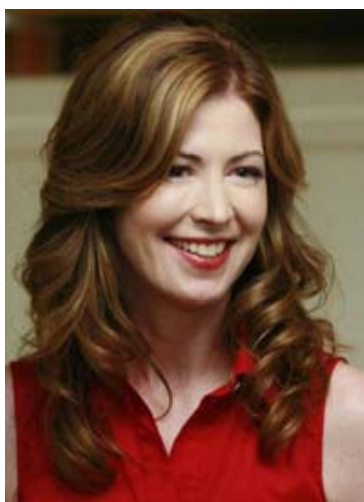
Katherine Mayfair (Dana Delany).

Desperate Housewives — Série américaine en 79 épisodes de 42 mn (4 saisons, toujours en production) diffusés depuis octobre 2004 sur ABC et depuis septembre 2005 sur Canal+.