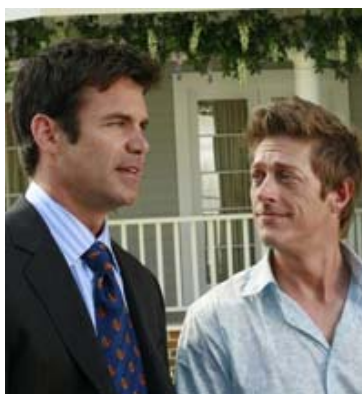
Bob Hunter (Tuc Watkins) et Lee McDermott (Kevin Rahm).

Le danger de trop attiser les curiosités écarté par ses révélations fracassantes, une autre menace se présente cependant à Katherine : sa « chère » tante Lilly, désireuse de révéler toute la vérité à Dylan avant de mourir.