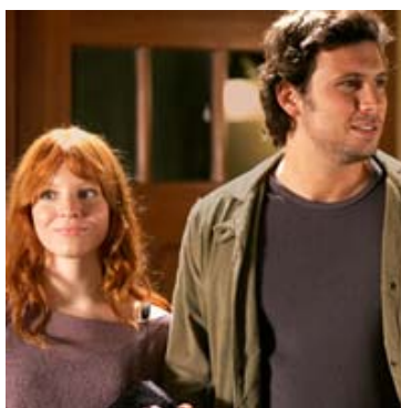
Claire Fisher (Lauren Ambrose) et Billy Chenowith (Jeremy Sisto).

Andrea Kuhn, 1963-2004 (tuée accidentellement par son mari) [4]. Six mois plus tard, Brenda et Nate préparent leur mariage et attendent un autre heureux évènement : la naissance d'un enfant (ce que le second ignore).