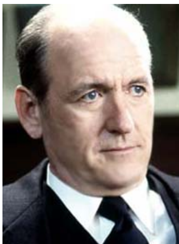
Nathaniel Fisher Sr. (Richard Jenkins).

Lila Simonds Coolidge, 1909-2005 (morte de vieillesse) . Le jour de ses 40 ans, Nate apprend que Brenda est enceinte mais il ne réagit pas comme elle l'attendait. Conscients de leurs troubles psychiques, George et Billy optent pour des remèdes différents :