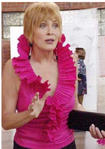
Margaret Chenowith (Joanna Cassidy).