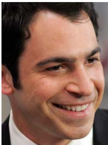
Ted Fairwell (Chris Messina).