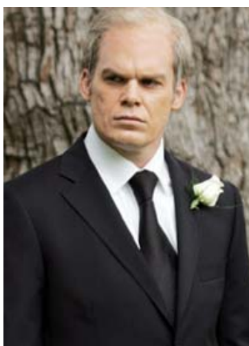
David Fisher (Michael C. Hall).

Ruth O'Connor Fisher, 1946-2025 (morte de vieillesse), Keith Dwayne Charles, 1968-2029 (tué par balles), David James Fisher, 1969-2044 (mort de vieillesse), Hector Federico Diaz, 1974-2049 (victime d'une crise cardiaque), Brenda Chenowith, 1969-2051 (morte de vieillesse), Claire Simone Fisher, 1983-2085 (morte de vieillesse).