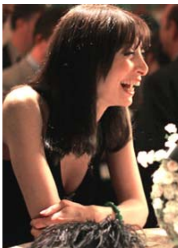
Angela (Illeana Douglas).

Loretta Smith Sibley, 1908-1953 (suicidée par l'absorption de médicaments). Le dossier d'adoption de David et de Keith échoue à cause des frasques passées du premier à Las Vegas. Ruth continue de buter sur le comportement incohérent de George malgré le soutien de sa fille, Maggie.