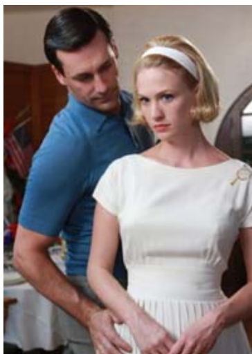
Don (Jon Hamm) et Betty Draper (January Jones).

Comme d'autres grands Jekyll et Hyde l'ayant précédé derrière le petit écran (Jim Profit, Tony Soprano, Dexter Morgan, Patty Hewes, Tom Jackman, la liste est longue), Don Draper cache sous les plis impeccables de ses chemises blanches parfaitement repassées